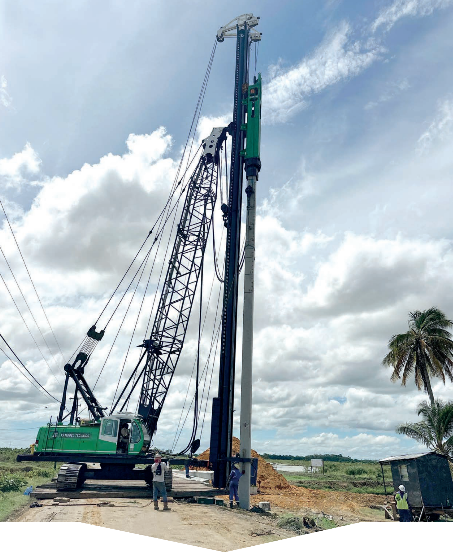
HEIWERKZAAMHEDEN IN VERBAND MET AANLEG TRANSMISSIELIJN NICKERIE